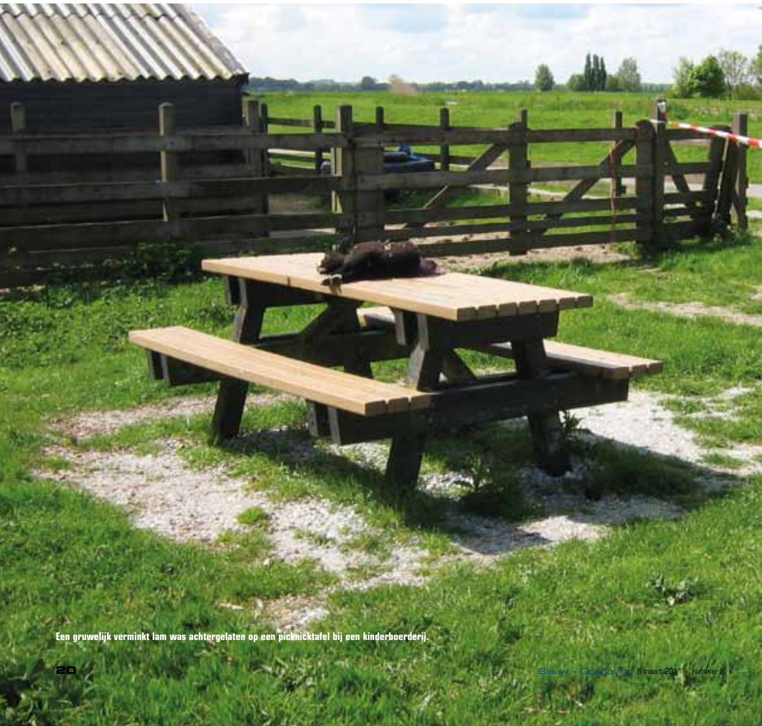
Een gruwelijk verminkt lam was achtergelaten op een picknicktafel bij een kinderboerderij.

De vondst van dode dieren duidt lang niet altijd op een misdrijf. Maar in het geval van seriematig gruwelijk verminkte en gedode dieren moeten alle alarmbellen gaan rinkelen. Forensisch onderzoek en zelfs sectie door het NFI kunnen helpen meer slachtoffers te voorkomen.