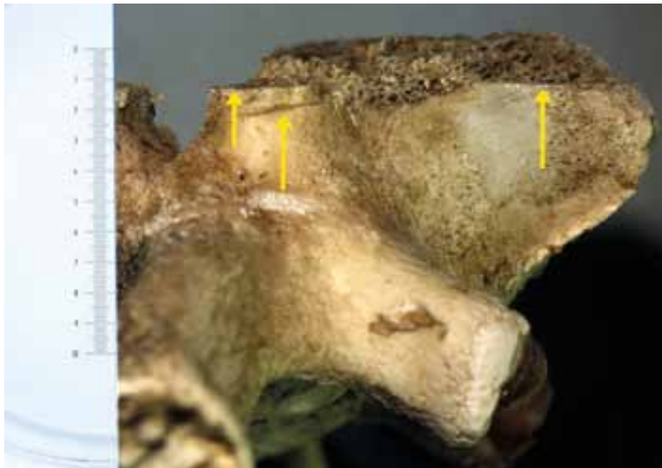
Ruggenwervel van lam met snijsporen (aangeduid met gele pijl). Aan deze snijsporen is te zien dat de wervel met een scherp voorwerp is beschadigd.