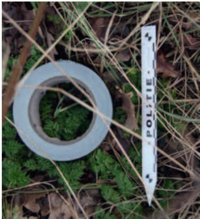
De rol tape die werd aangetroffen langs de weg. Na onderzoek bleek deze te matchen met tape aangetroffen in de vakantiewoning.

Litouwen. “Ons aanvankelijke plan om hen in Nederland te traceren en te volgen, konden we dus niet uitvoeren”, zegt Leo Lamberts, plaatsvervangend coördinator. “Maar omdat we toch waren begonnen, hebben we besloten ons helemaal op de zaak Hardenberg te concentreren.”