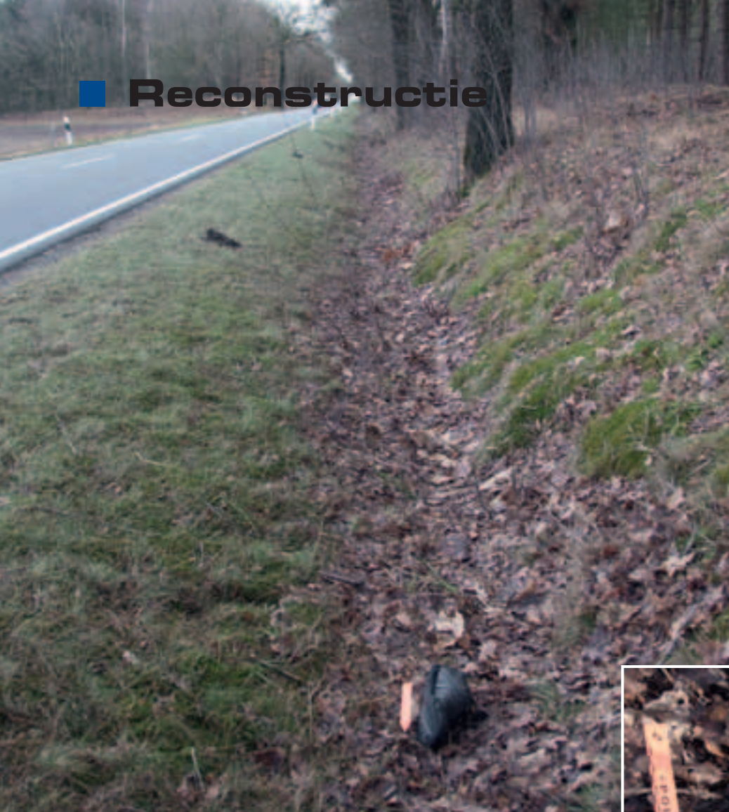
In Duitsland worden langs de weg schoenen, handschoenen en bivakmutsen aangetroffen.