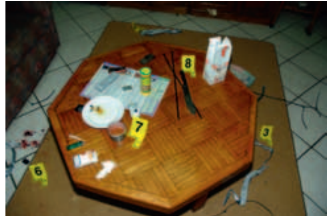
De vakantiewoning na de overval. Op de vloer de tape en op het tafeltje de rol tape en tiewraps.

Een bende criminelen uit Litouwen pleegt gewelddadige overvallen in heel West-Europa. Dankzij technisch bewijs en internationale samenwerking komen de daders achter de tralies terecht.