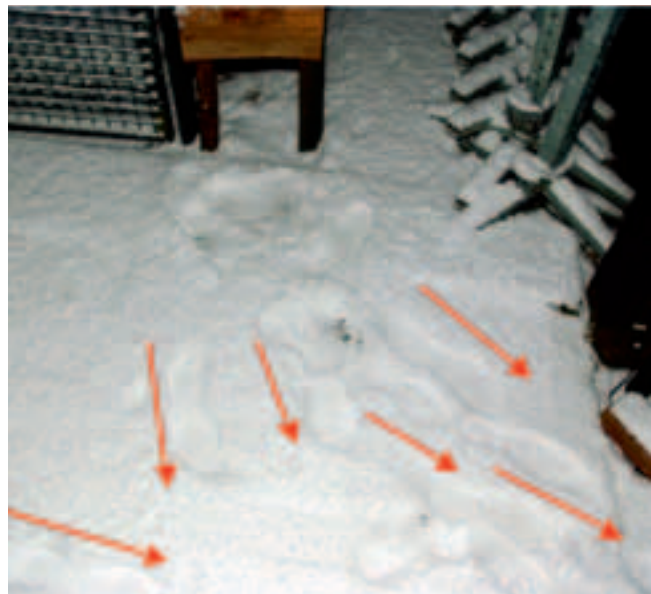
Zes verschillende schoensporen in de sneeuw.

Met zo weinig informatie dreigt het onderzoek op dood spoor te raken, totdat acht dagen later een vrouw zich meldt bij de politie. Zij liet vlak bij de Duitse grens, zo'n anderhalve kilometer verderop, haar hond uit en vond daar langs de weg schoenen, hand-