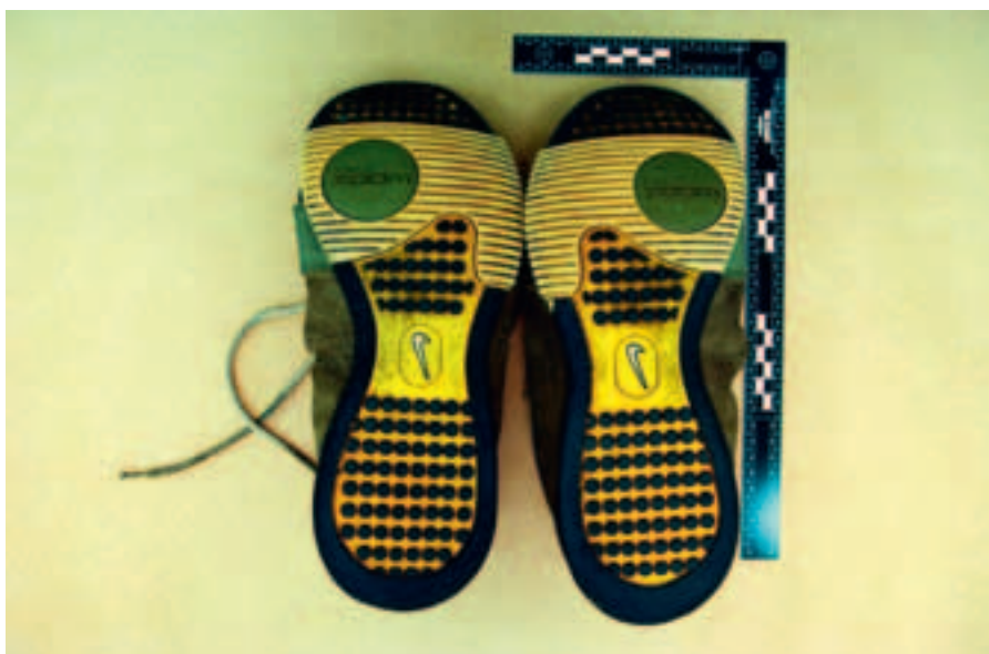
De Nike Zoom schoenen.