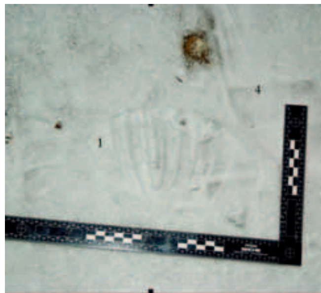
Detail van een van de schoensporen.

schoenen en bivakmutsen. De recherche gaat op onderzoek uit en verzamelt over bijna anderhalve kilometer lengte zes schoenen, zes handschoenen, vijf mutsen en een rol duct tape. Als dit eigendommen zijn geweest van de verdachten, hebben zij ze vermoedelijk uit de rijdende auto gegooid om er zo snel mogelijk van af te komen. Waarschijnlijk zijn de spullen niet eerder opgevallend door de sneeuw, die inmiddels is weggeregend. De gevonden voorwerpen worden bemonsterd, wat lastig gaat omdat ze een aantal dagen in de regen hebben gelegen. Toch komt er DNA-materiaal tevoorschijn van de handschoenen en van enkele haren in een paar bivak-