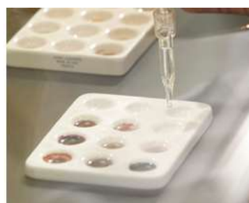
Foto 1. Het uitvoeren van een kleurtest

Kleurtesten zijn reagentia waarmee bepaalde drugs een kleurreactie geven. Deze testen geven een indicatie voor de aanwezigheid van een bepaalde drug. Voor de uitvoering van een kleurtest wordt een geringe hoeveelheid van het te onderzoeken materiaal met het reagens samengebracht.