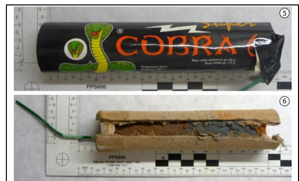
Foto 5. Voorbeeld van een intacte Super Cobra 6 met rode kleipropen.