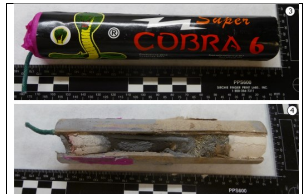
Foto 3. Voorbeeld van een intacte Super Cobra 6 met witte kleipropen.

Het NFI heeft ook varianten van de Super Cobra 6 in onderzoek gehad die witte en/of rode kleipropen bevatten als afdichtingsmateriaal (zie bijvoorbeeld foto's 3 t/m 6). De door het NFI onderzochte varianten bevatten circa 18 tot 40 gram flietpoeder.