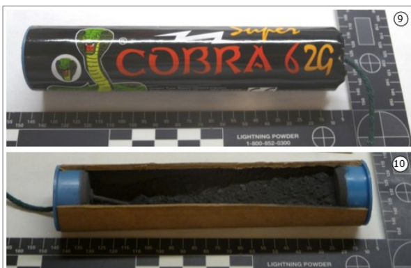
Foto 9. Voorbeeld van een intacte Super Cobra 6 2G. Foto 10. Binnenkant van de Super Cobra 6 2G.

De Super Cobra 6 2G is afgebeeld op foto 9 (intact) en foto 10 (inwendige opbouw).