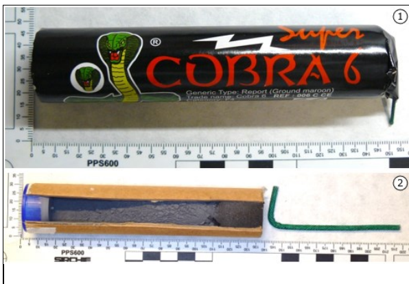
Foto 1. Voorbeeld van een intacte Super Cobra 6.

De Super Cobra 6 is een pyrotechnisch artikel 1 bestaande uit een kartonnen koker met een zwart etiket (zie foto 1). Op dit etiket zijn altijd de aanduiding 'Super Cobra 6' en een tekening van een groene slang aanwezig. Lettertypes, kleuren en details in de tekening kunnen variëren, evenals de taal en tekst van de verdere opdrukken 2 .