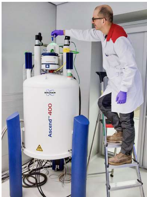
Figuur 4: NMR apparatuur

Net als bij FTIR wordt er bij NMR gebruik gemaakt van de interactie tussen stoffen en licht. In het geval van NMR gaat het om radiogolven die een interactie aangaan met het magnetisch veld van de atoomkern in een verbinding. Deze kunnen worden gemeten en worden als spectrum weergegeven. Er kunnen verschillende atoomkernen worden gemeten. Voor het team Verdovende Middelen zijn waterstof en koolstof het meest relevant. De techniek heeft een groot onderscheidend vermogen omdat elke stof een unieke 3-dimensionale samenstelling van atoomkernen is en daardoor een karakteristiek NMR-spectrum heeft.