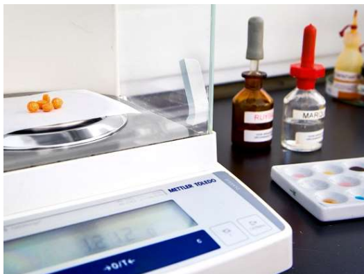
Figuur 1: Vooronderzoek