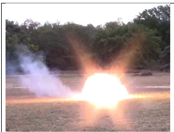
Foto 7. Explosie van een Cobra 8.

Zoals aan het begin van deze paragraaf toegelicht, is de gevaarzetting van een ontploffende Cobra 8 van vele factoren afhankelijk. Indien deze vakbijlage onvoldoende inzicht geeft in de gevaarzetting van een specifieke zaak, is het aan te raden om contact op te nemen met het NFI. Dit geldt ook als er in een zaak sprake is van meer dan één Cobra 8 exemplaar of één Cobra 8 in combinatie met andere vuurwerkartikelen (zie ook §4.2). Ook als er veranderingen aan de Cobra 8 zijn aangebracht (zoals bijvoorbeeld de toevoeging van een spuitbus, spijkers, fles benzine, etc.) wordt aangeraden contact op te nemen met het NFI.