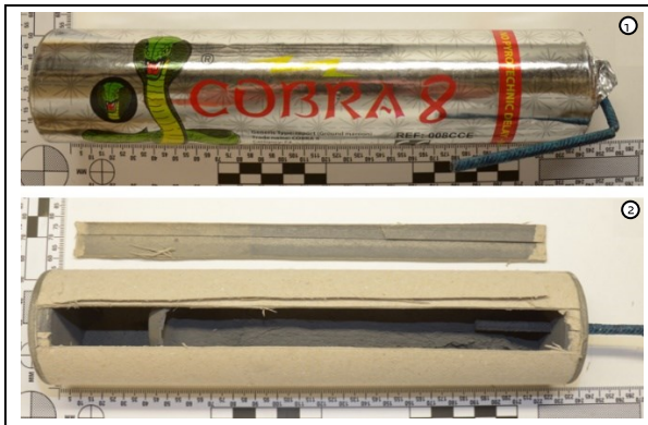
Foto 1. Voorbeeld van een intacte Cobra 8.

De Cobra 8 (zonder voorlading) is een pyrotechnisch artikel 1 bestaande uit een kartonnen koker met een glimmend zilverkleurig papieren etiket met sterren erop (zie foto 1). Op dit etiket zijn altijd de aanduiding 'Cobra 8' en een tekening van een groene slang aanwezig. Lettertypes, kleuren en details in de tekening kunnen variëren.