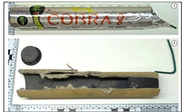
Foto 3. Voorbeeld van een intacte Cobra 8 met voorlading.

Het NFI heeft ook een variant van de Cobra 8 in onderzoek gehad die een voorlading van zwart buskruit 3 bevat (zie foto 3).