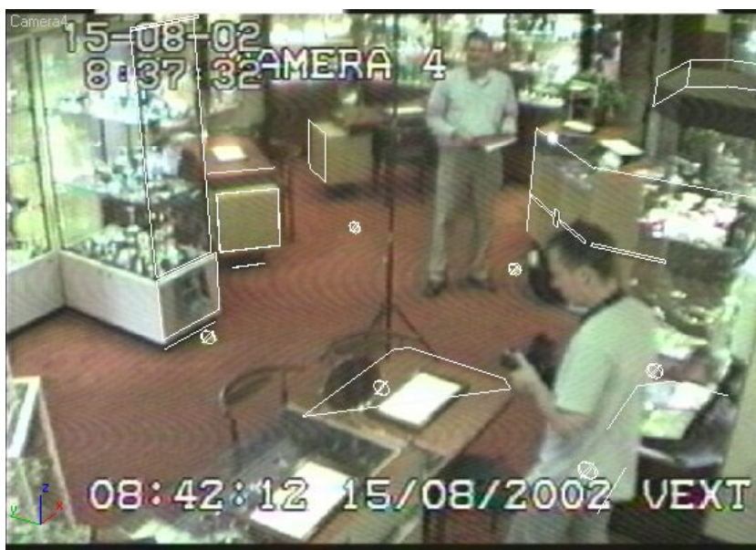
Figuur 3. Eenvoudig driedimensionaal computermodel geprojecteerd op het camerabeeld.

Het model bestaat slechts uit punten en lijnen. Het computermodel in deze figuren is daarom weinig aansprekend voor mensen die geen ervaring hebben met dit soort modellen. Maar elke punt is wel met de grootst mogelijke nauwkeurigheid vastgelegd.